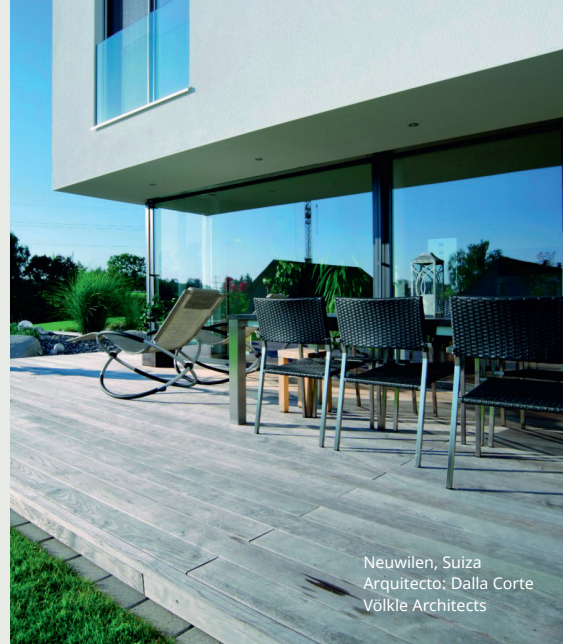
Neuwilen, Suiza Arquitecto: Dalla Corte Völkle Architects